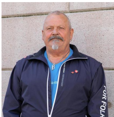
2. plass: Olav Halgeir Nordli Politiske interessefelt: