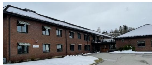
↑ Marka sykehjem, Brandbu

Gran FrP står fast på at det bør sørges for god utnyttelse, forbedring og vedlikehold av eksisterende sykehjem til nytt alternativ står ferdig. Gran FrP vil prioritere best mulig livskvalitet for de som trenger daglig hjelp og omsorg, vi kaller det Leve hele livet!