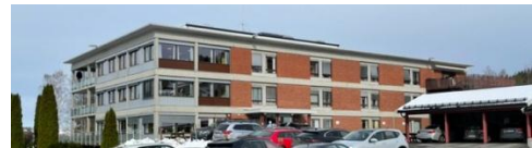
↑ Skjervum sykehjem, Gran